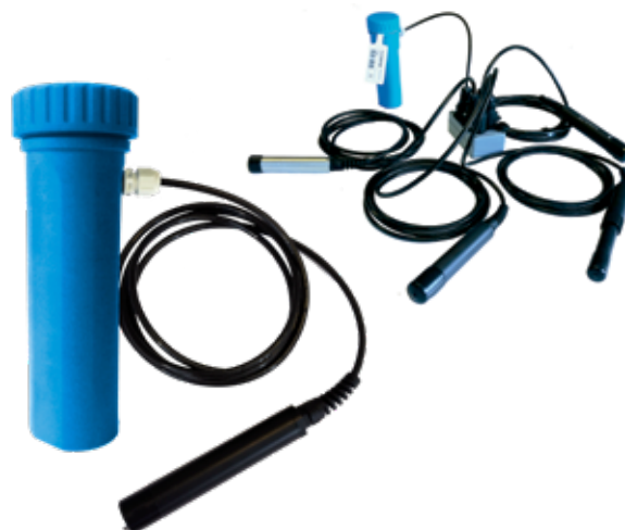
QU waterkwaliteitsmeters met 1 tot max. 4 sensoren